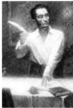
Firma decreto guerra a muerte