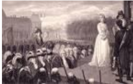
La Reina de Francia María Antonieta. Muere guillotinado.