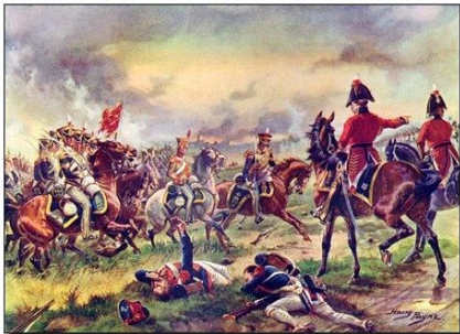
BATALLA DE WATERLOO EN BÉLGICA

prusianos, ingleses y alemanes. Cuando más confiados estaban libando licores, fueron sorprendidos cuando Napoleón como un mago salido del infierno, se presentó en Francia, rápidamente organizó un ejército nuevo, lo suficientemente grande como para enfrentar y derrotar la coalición organizándose para la gran batalla.