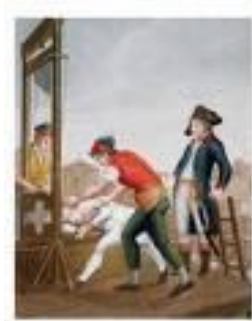
El terror de Francia Maximilien Robespierre. Muere guillotinado, conjuntamente con todos sus seguidores.