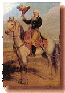
LOS DOS GRANDES REVOLUCIONARIOS