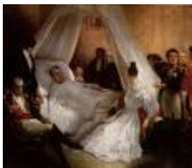
El Cónsul y Emperador de Francia Napoleón Bonaparte. Muere triste, enfermo y solitario en la isla rocosa de Santa Elena.