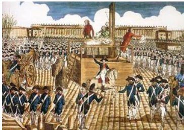
El fundador de la Revolución Georges Jacques Danton. Muere guillotinado.