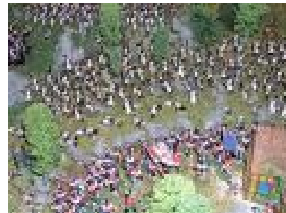
BATALLA DE WATERLOO EN BÉLGICA

“LA GRAN BATALLA FINAL” . – Los prusianos y los ingleses, derrotaron a Napoleón definitivamente en la Batalla de Waterloo en Bélgica, desterrándolo a una isla muy lejana llamada “Santa Elena” en el Atlántico Sur, para que allí reflexionara sobre su vanidad de sus aspiraciones, las mismas que tienen derecho todos los seres humanos del mundo entero.