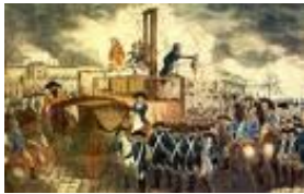
El Rey de Francia Luís XVI. Muere guillotinado.