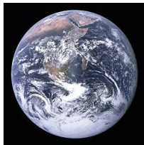
Diámetro: 12.743 Km.