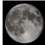
Diámetro: 3.474 km.

Este mismo efecto sucede con nuestra sangre en nuestro cerebro. ¡Amigo lector! Aunque usted no lo crea, todos sufrimos un poco de esta presión en tiempos de luna llena, claro está: unos más que otros.