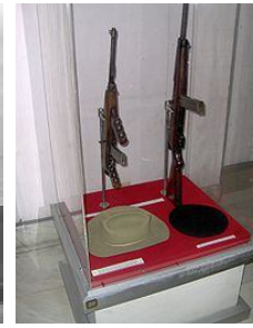
El lavadero. Capilla ardiente del Ché. El Ché Guevara muerto. Del Ché y Cienfuegos