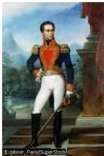
EL LIBERTADOR SIMÓN BOLÍVAR

Busque la Sexta parte de este reportaje en (Prensa) www.farandulo.net