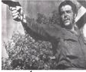
EL CHÉ DISPARANDO