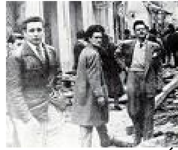
FIDEL EN BOGOTÁ

En el año 1.848, Fidel Castro fue enviado a Colombia como delegado de la IX Conferencia Interamericana. Fidel estaba citado para encontrarse con Jorge Eleazar Gaitán la misma tarde en que fue asesinado en el llamado Bogotazo. Así empezó Fidel Castro sus correrías políticas, comunista, marxista y leninista y, empezó la guerrilla en Colombia.