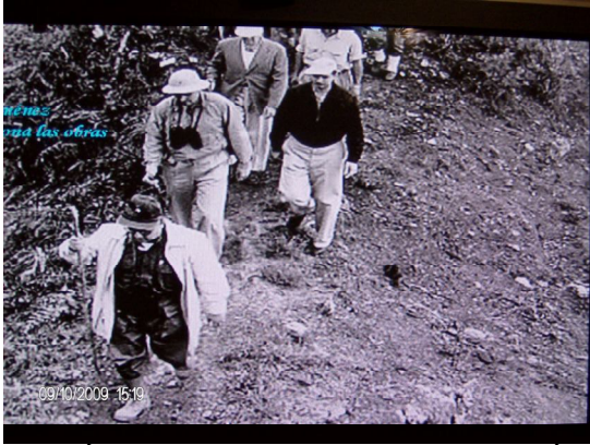
PÉREZ JIMÉNEZ EN LA CUMBRE DEL CERRO ÁVILA