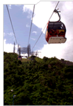
TELEFÉRICO DEL ÁVILA EN CARACAS

Buenos días Señor Ávila ¿leo la prensa ya? ¿Se enteró de que pronto con un tren de jugar Su solapa de flores le condecorarán? ¡OH, no! ¡No, No! No llore, será se lo aseguro Un tren de navidad con el que usted, si quiere Podrá también jugar