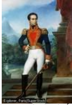
LIBERTADOR S. BOLÍVAR