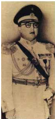
Pérez Jiménez fue el actor principal de la dictadura de la década de los 50

El General Marcos Pérez Jiménez. Fue el presidente más demócrata, más patriota y más progresista que tuvo Venezuela desde los días de la Independencia. El síndrome del General Pérez Jiménez, sólo era la construcción de Venezuela. Como el decía: “Yo haré que Venezuela sea la primera nación de toda Latinoamérica. La más grande, la más próspera y la más culta...Yo haré que se cumplan los pensamientos del Libertador Simón Bolívar. “Cesarán los partidos y se consolidará la unión, la Moral y Luces, son nuestras primeras necesidades”.