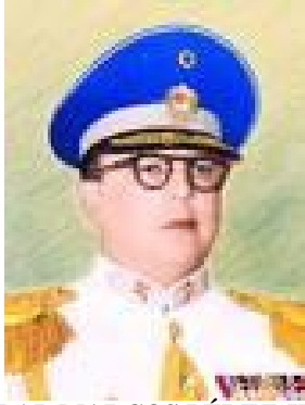
GENERAL MARCOS PÉREZ JIMÉNEZ