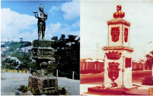
Monumentos a los Gaiteriros de Soutelo y a Rosalía PUBLI