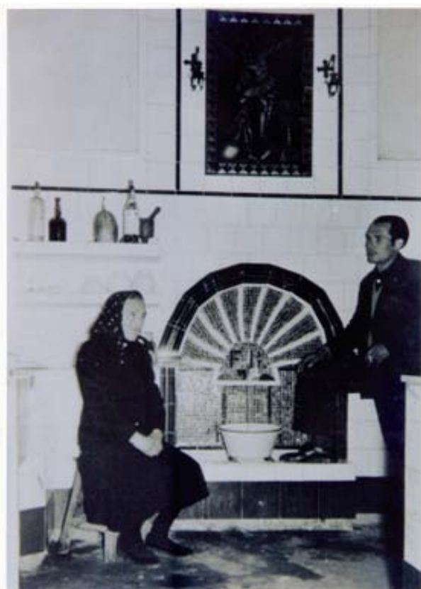
Con su madre.