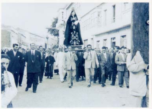
De blanco, llevando La Virgen en Forcarei.