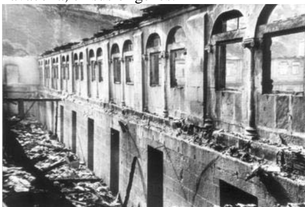
Samos, tras el incendio de 1951.