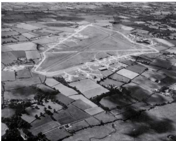
Lavacolla, en sus orígenes.