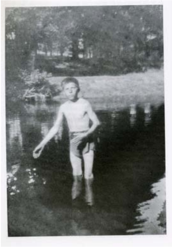
Siendo niño en Forcarei.