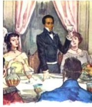
REUNIONES DE BOLÍVAR CON SUS AMIGAS