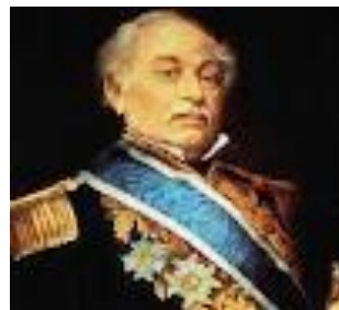
HERMANA DE BOLÍVAR REPATRIACIÓN DE LOS RESTOS GENERAL PAEZ

Cuenta la historia que Bolívar en una de sus constituciones estableció la idea de un vicepresidente para la conformación de la gran Colombia. La mayoría de los Venezolanos con Páez a la cabeza se opuso rotundamente más aun cuando Bolívar pretendía establecer la capitania general en Colombia. Siendo este el motivo que conllevó a la expulsión de Bolívar de su tierra natal Venezuela, desde entonces los colombianos anotaron en sus mentalidades este pasaje historio.