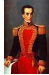
DOMINGO MONTEVERDE. FIRMA DEL ACTA DE LA INDEPENDENCIA. SIMÓN BOLÍVAR

Participar, personalmente, en el asalto y detención de Miranda en La Guaira, traicionándolo de esta forma al entregarlo engrillado al general español Monteverde -quien lo envió a Cádiz donde luego moriría-. Esta traición la reseña Marx como debidamente recompensada con la expedición del pasaporte español a Bolívar, en reconocimiento por su 'servicio prestado al Rey de España con la entrega de Miranda'.