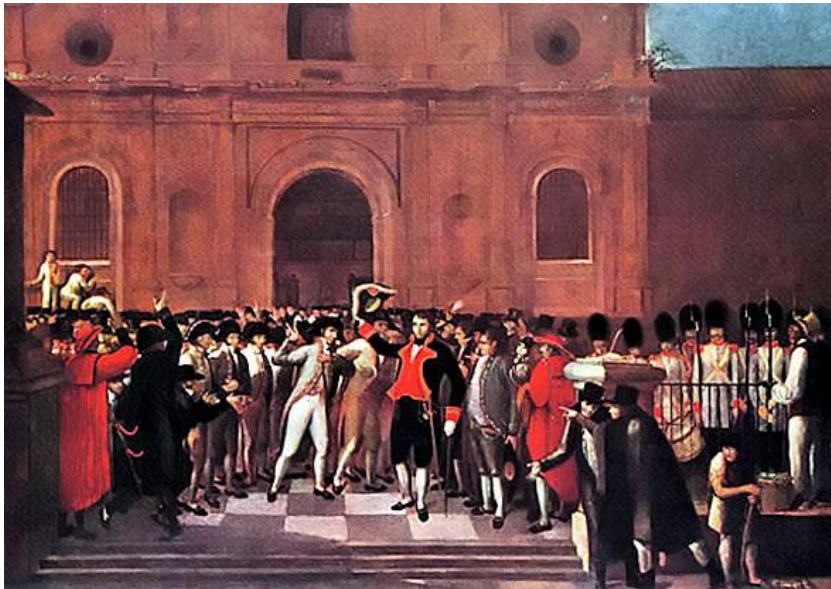
REVOLUCION DEL 19 DE ABRIL DE 1.810

Marx comienza su artículo refiriéndose a Bolívar como un descendiente de familias mantuanas, que en la época de la dominación española constituían la nobleza criolla en Venezuela. Luego, Marx continúa su relato emitiendo una serie de afirmaciones y conceptos ciertamente prejuiciados, inexactos o deformados sobre la vida del Libertador. En este sentido afirma que el Libertador rehusó adherirse a la revolución que estalló en Caracas el 19 de abril de 1810, a pesar de las instancias de su primo José Félix Ribas. En cuanto a la misión de Bolívar a Londres en 1811 (junto con Bello y López Méndez), Marx afirma que ésta se redujo a la autorización para exportar armas, teniendo que abonarlas de contado y pagar fuertes derechos.