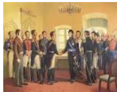
CONGRESO EN PANAMÁ

El Congreso de Panamá (1826) fue convocado por Bolívar con la intención real de unificar América del Sur en una república federal, cuyo dictador quería ser él mismo. Los diversos mandatos de Bolívar al frente de la Gran Colombia fueron planeados por él para satisfacer sus apetencias de poderes dictatoriales.