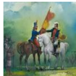
REUNIONES DE TRIUNFOS

Para sorpresa nuestra, resulta que una de las críticas más duras de Marx contra Bolívar se relaciona con la naciente república de Bolivia y la forma odiosamente bonapartista (en términos marxistas) con que el Libertador diseñaba la estructura del naciente Estado boliviano. Como es sabido, Bolívar se desplazó a los Andes peruanos tras una exitosa campaña en Ecuador, dejando atrás antiguas rivalidades y animadversiones que sostenía con sus propios correligionarios venezolanos y colombianos. Al fundarse Bolivia, el Libertador redactó su famosa Constitución Vitalicia, conocida por Marx como el "Código Boliviano".