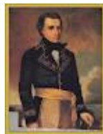
MANUEL CARLOS PIAR