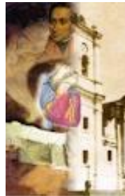
CORAZÓN DE BOLÍVAR