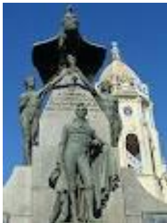
MONUMENTO EN PANAMÁ

Marx describe la victoria en la toma de Santa Marta en 1814 como una hazaña en la cual, a pesar de que la ciudad ya había capitulado, Bolívar le permitió a sus soldados que la saquearan durante cuarenta y ocho horas. La retirada a Jamaica en 1815 es descrita como una huida de Bolívar durante ocho largos meses, mientras los generales patriotas ofrecían su tenaz resistencia en Venezuela; y la Carta de Jamaica es una defensa de Bolívar ante su fuga de los españoles,