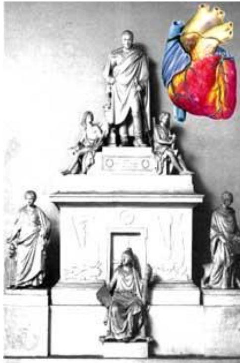
CORAZÓN DE SIMÓN BOLÍVAR