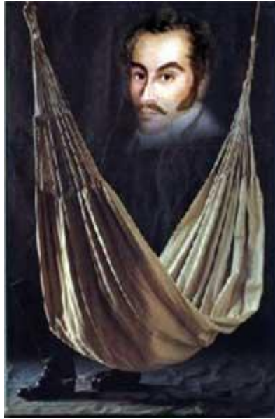
BOLIVAR EN SU HAMACA

En la descripción personal de Bolívar que Marx cita de Docoudary-Holstein, se lee entre otras perlas lo siguiente: