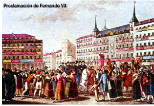
FIESTA AL REY FERNANDO VI