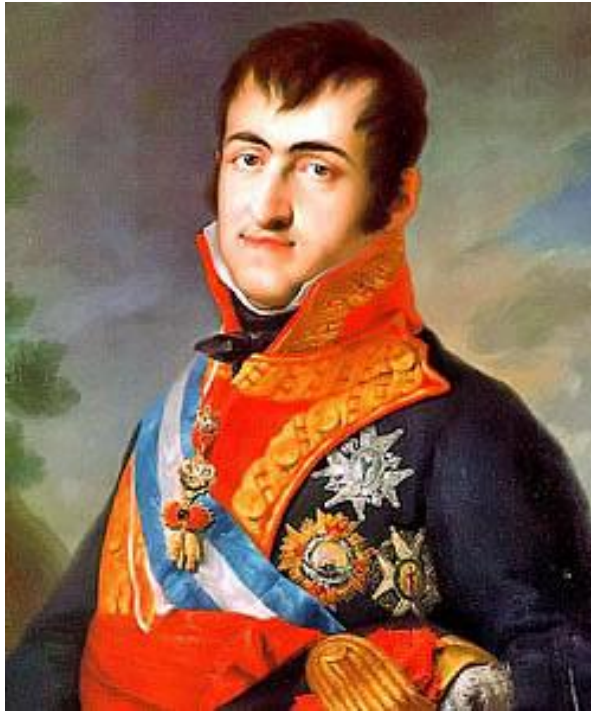
REY FERNANDO VI