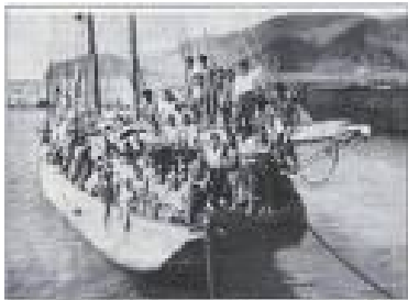
Apresados en Venezuela 160 inmigrantes ilegales Canarios

Portugueses, italianos y españoles. Fueron, son y serán por todos los tiempos, las mejores que pisaron estas tierras de gracia. Todos portadores de las mejores calidades y cualidades humanas, en lo cultural, profesional y económico, todos hacedores de pueblos y, forjadores de familias. Se puede decir, que toda la infraestructura que existe en Venezuela, tienen las huellas marcadas del emigrante de la década del 50.