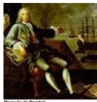
Marquise de Pombal

dar luces a una nación cuya población raya en los 30.000.000 de habitantes.